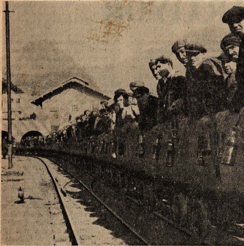
İşçiler kömür vagonları içinde ocağa girerken.

İşçiler, grev uygulamasına hemen başladığı takdirde, patronun uzun süre greve dayanamayacağını belirtmektedirler. Zira fabrikada 500 metre küp tomruk bulunduğunu ve patronun bu tomrukları kısa sürede bitirmek zorun-