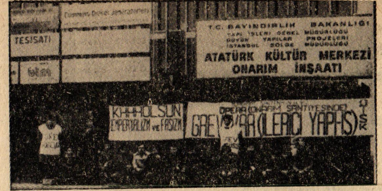
Kültür Sarayı işçilerinin grevinden bir görünüş.

— Sendikamızdan çok memnunuz. Hep beraber çalışmaktayız. Yönetici arkadaşlarımıza yardımcı oluyoruz. Fakat işveren çok baskı yapıyor. Disk'i kötü-lüyor. Ama ne derlerse desinler. Biz 1800 - 1900 lira aylıkla hiçbir zaman geçinemeyiz. Görüyorsunuz Disk'e bağlıyız. İşverenler ne kadar yırtınırsa yırtınsın bu sarı sendikacılar ama bugün ama yarın ortadan kalkacak. Bunlar ortadan kalkmadıkça biz işçi kitlesi hiçbir kâr sağlayamayız.